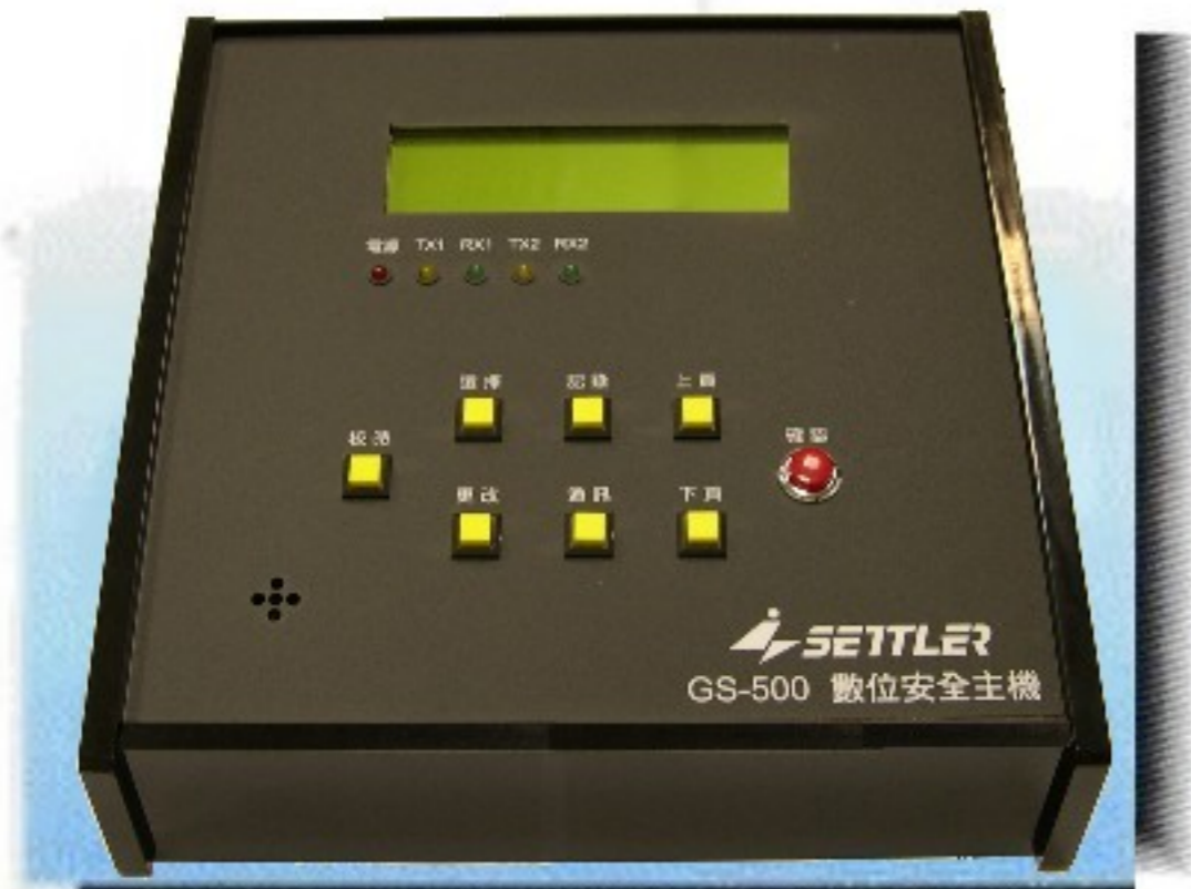
GS-500 液晶中文顯示受信總機